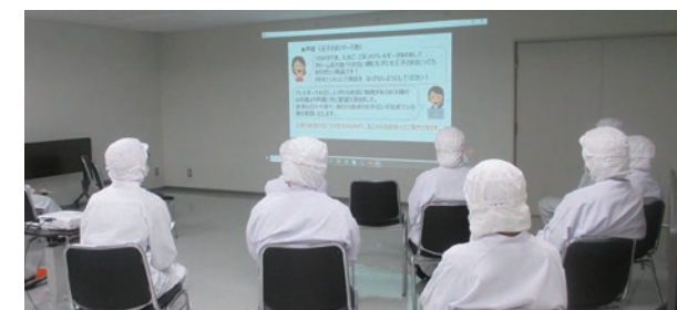
VOC共有会(リモート実施)の様子

お客様の声を全従業員に届けることを目的とし、自社・関連工場向けに「VOC共有会」を実施しています。お客様からのお問い合わせの状況や、実際のお客様の声を伝えることで、従業員のモチベーションアップや、お客様に安全・安心な商品をお届けするという意識向上につながっています。