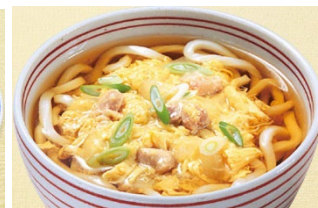
親子丼：卵とじうどん