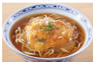
天津飯：天津ラーメン