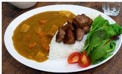
ステーキとも相性抜群！