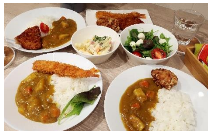
無限のアレンジで家族みんなが楽しめる！

ご飯や麺にかける、お好みのトッピングでアレンジするなど、自由な食べ方を楽しむことができます。