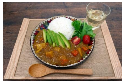
自宅でカフェ風ごはん

エスビー食品グローバルサイト（簡体中文）： https://www.sbfoods-worldwide.com/zh-cn/