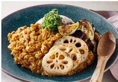
<大人好みの鶏キーマカレー>