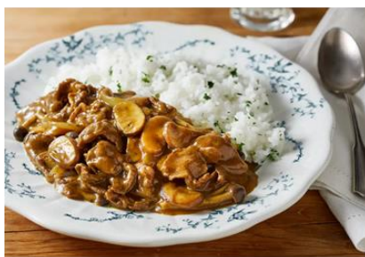
<牛肉と2種のきのこのとっておきカレー>

また、パウダータイプならではの使い勝手の良さを活かした、アレンジレシピを多数掲載しております。