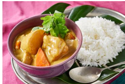
<マッサマン風チキンカレー>