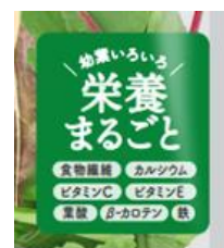
<有機 JAS 認証> <栄養成分をわかりやすく表示>

「一番摘み」: 畑で種から育て、一番最初に摘み取る、一回採りの栽培・収穫方法のことです。 ふんわりとしたやわらかい口あたりが特徴です。