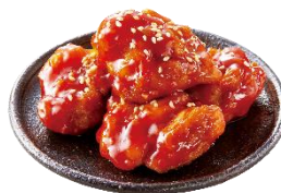
<ヤンニョムチキン>