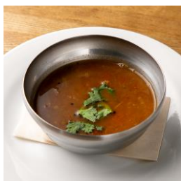
タリカロ（東京・西荻窪）