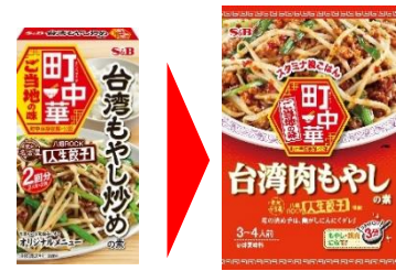
<旧パッケージ 小箱><新パッケージ 袋>

ボリューム感と簡単調理を重視するファミリーでの利用実態に合わせ、パッケージを小箱から袋に、また、内容を「2人前×2」から「3~4人前」に変更。さらに、ボリュームのあるおかずを想起させるため、メニュー名を「あんかけ野菜炒め」を「五目うま煮」に、「台湾もやし炒め」を「台湾肉もやし」に変更します。