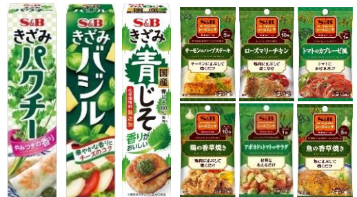
<ノベルティイメージ>