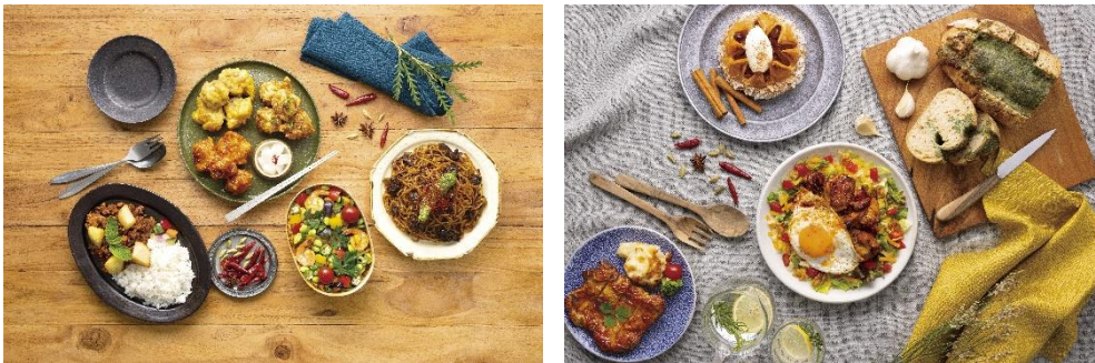
<メニューイメージ>

◆「スパイス&ハーブフェア」URL： https://www.ecute.jp/shinagawa/campaign/2290