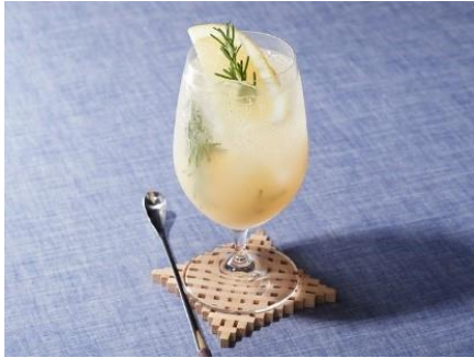
<モクテルイメージ>

https://www.ecute.jp/shinagawa/campaign/2290