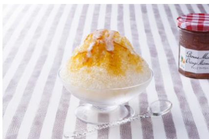
かき氷シロップとして