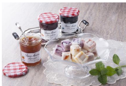
ヨーグルトと白ワインと混ぜて 冷やし固めて大人のヨーグルトアイスに