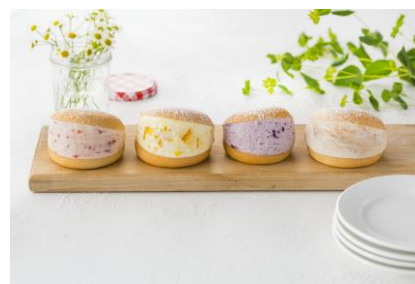
泡立てた生クリームと混ぜて マリトッツオのクリームに