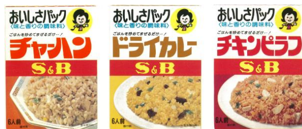
<発売当時のパッケージ>

1976年に「おいしさ革命、味と香りの調味料」というコンセプトで発売した、お好みの具材と炒めるだけでパラっと仕上がり、多彩な炒めご飯が作れる「おいしさパック」。低価格でありながら“家庭にある食材で手軽に本格的な炒めご飯が楽しめる”と発売当時からご好評いただいている、ロングセラーシリーズです。