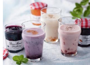
フルーツラッシー