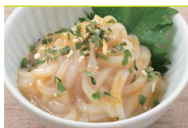
<いかそうめんのゆずみそ和え>