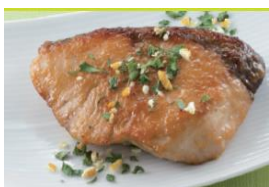
<ぶりのゆずみそ焼き>