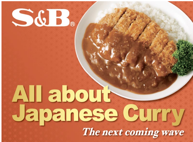
出展テーマ：All about Japanese Curry