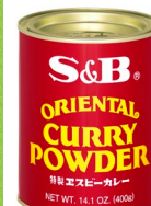
ベジタブルカレー