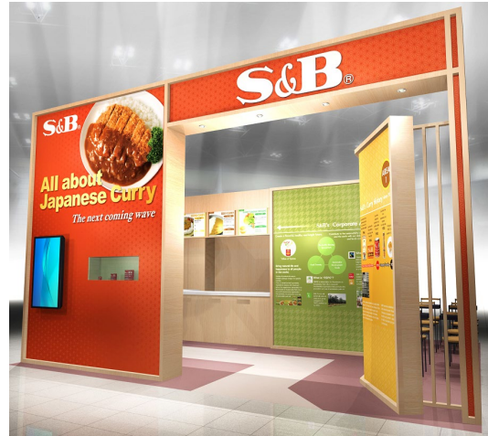
出展ブースイメージ

エスビー食品株式会社は、2019年11月27日（水）～29日（金）の3日間、幕張メッセで開催される「第3回“日本の食品”輸出 EXPO」に出展します。