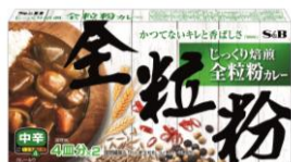
<2016年終売の「全粒粉カレー」(固形ルウタイプ)>

「全粒粉カレー」は2016年3月に終売して以降、健康的なカレーにこだわりを持つお客様から、再販希望の声が多く寄せられました。お客様に美味しく、健やかで、明るい未来をお届けすべく、全粒粉カレーならではの健康感と、素材が持つ「おいしさ」「香ばしさ」を表現したカレーを再提案します。