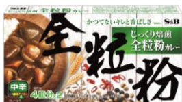
<2016年終売の「全粒粉カレー」（固形ルウタイプ）>

「全粒粉カレー」は2016年3月に終売して以降、健康的なカレーにこだわりを持つお客様から、再販希望の声が多く寄せられました。お客様に美味しく、健やかで、明るい未来をお届けすべく、全粒粉カレーならではの健康感と、素材が持つ「おいしさ」「香ばしさ」を表現したカレーを再提案します。