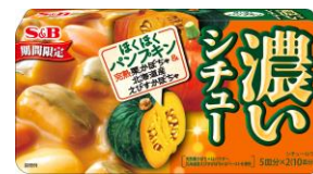
◆ほくほくパンプキン