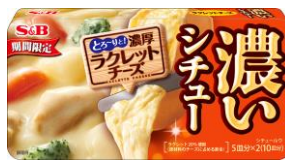
◆ラクレットチーズ