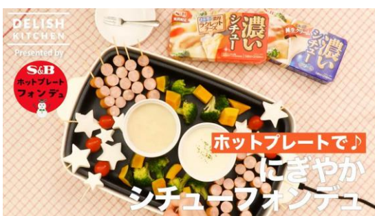
◆「DELISH KITCHEN」タイアップレシピ動画 イメージ

ブランドサイト： http://www.sbfoods.co.jp/koistew/