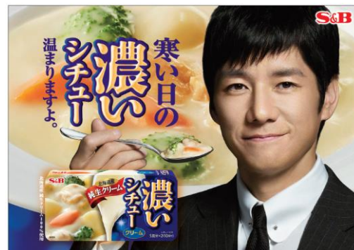
◆濃いシチュー クリーム 店頭POP