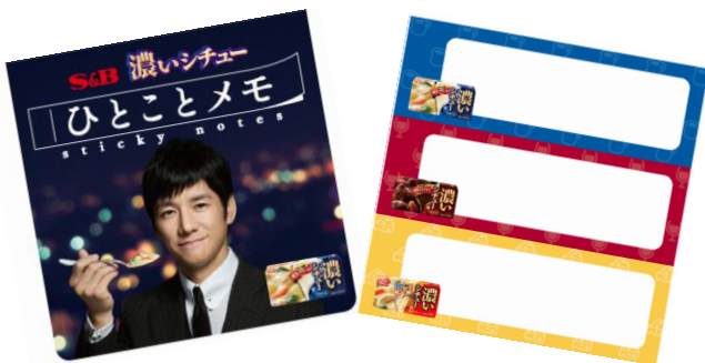
◆メモパッドイメージ