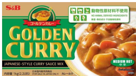
【業務用】 ゴールデンカレー 動物性原材料不使用 1 kg