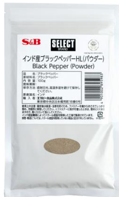
【業務用】 セレクトスパイス インド産ブラックペッパーHL (あらびき、パウダー) ※ハラール認証品