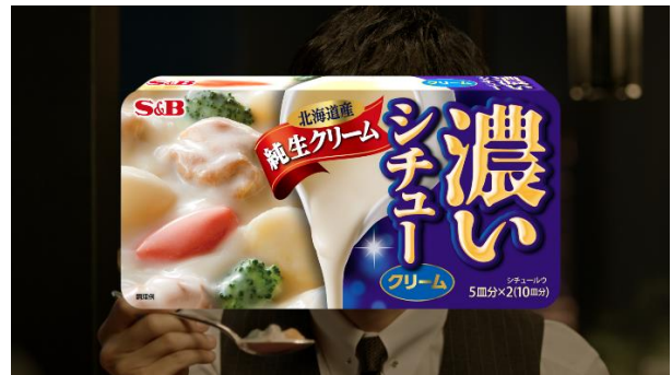
ここだけの話 純生クリーム篇